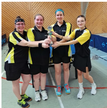
Damen BK Team Bezirkspokal Mittelfranken Nord 2025/26