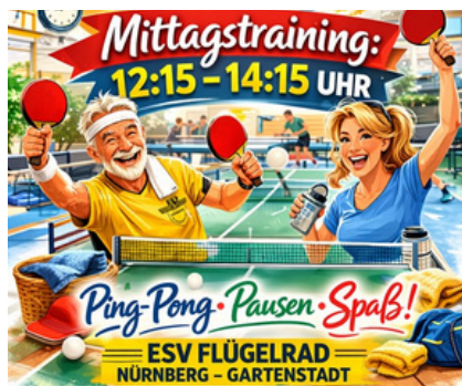
Highlight: Mittagstraining am ESV